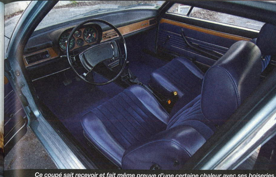
Ce coupé sait recevoir et fait même preuve d'une certaine chaleur avec ses boiseries.

"Cette voiture est très homogène... mais on lui souhaiterait un peu de personnalité et de séduction. Cela tient à peu de choses mais bien souvent les clients sont plus sensibles →