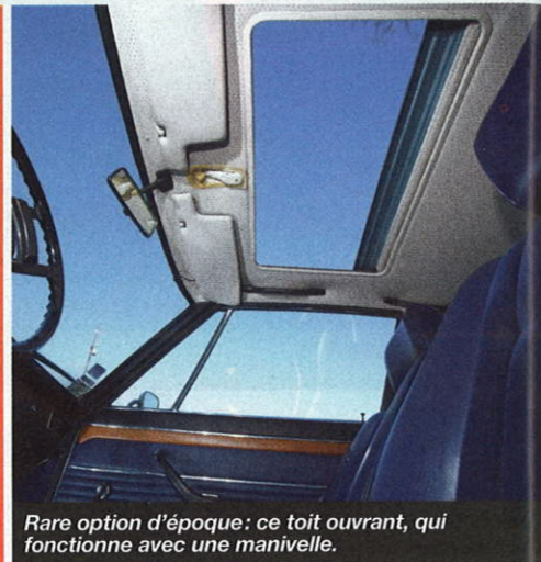
Rare option d'époque: ce toit ouvrant, qui fonctionne avec une manivelle.