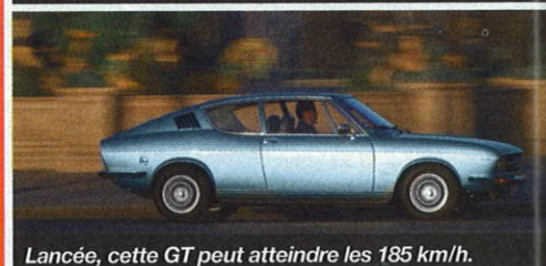
Lancée, cette GT peut atteindre les 185 km/h.