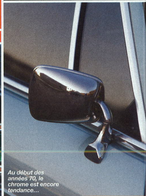
Au début des années 70, le chrome est encore tendance...