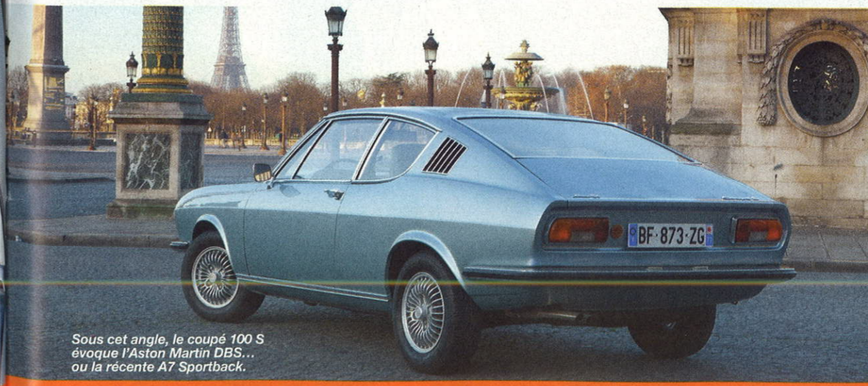
Sous cet angle, le coupé 100 S évoque l'Aston Martin DBS... ou la récente A7 Sportback.

à des impressions qu'à des qualités réelles... Faudrait-il donc qu'elle soit un peu plus bruyante pour être considérée comme vraiment sportive?" Bernard Carat (L'Auto-Journal du 15 mars 1972)